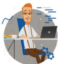
Wprowadzenie do PPP

ZAPRASZAMY NA BEZPŁATNE SZKOLENIA E-LEARNING Z ZAKRESU PPP