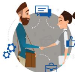
Wybór partnera prywatnego