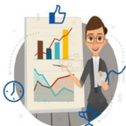
Przygotowanie projektu PPP