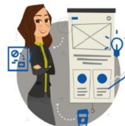
Zarządzanie umową o PPP