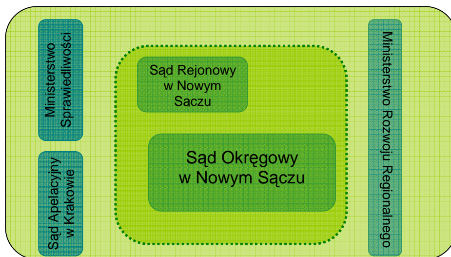
Schemat 1: Zespół Sterujący dla Projektu

Jak określono w ww. Zarządzeniu, do zadań Zespołu należy przede wszystkim wsparcie i uzupełnienie działań podejmowanych przez Sąd Okręgowy w Nowym Sączu – stronę publiczną – przy realizacji tego Projektu, w szczególności poprzez: