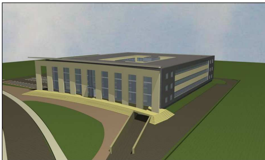
Wizualizacja projektu, źródło: Sąd Okręgowy w Nowym Sączu

Podstawową potrzebą jest wybudowanie nowej siedziby sądu, spełniającej standardy bezpieczeństwa, zapewniającej odpowiednią powierzchnię sal rozpraw, sekretariatów i gabinetów sędziowskich, archiwum zakładowego i ksiąg wieczystych pozwalającą stworzyć wysoki komfort pracy i obsługi interesantów. Obecnie główną siedzibą obu nowosądeckich sądów (okręgowego i rejonowego) jest budynek zaprojektowany przez wiedeńskiego architekta i powstały w latach 1898 - 1901 w miejscu dawnego klasztoru ojców Pijarów, a ponadto drugi budynek sądowy przy ul. Strzeleckiej oraz wynajęte lokale na terenie miasta Nowego Sącza. Nowa siedziba Sądu Rejonowego niewątpliwie usprawni jego funkcjonowanie, co będzie znacznym ułatwieniem dla mieszkańców regionu, wpłynie również korzystnie na sprawne funkcjonowanie Sądu Okręgowego w Nowym Sączu (pozwoli na pozyskanie dodatkowych powierzchni lokalowych dla tej jednostki sądowej - zgodnie z rzeczywistymi jej potrzebami).